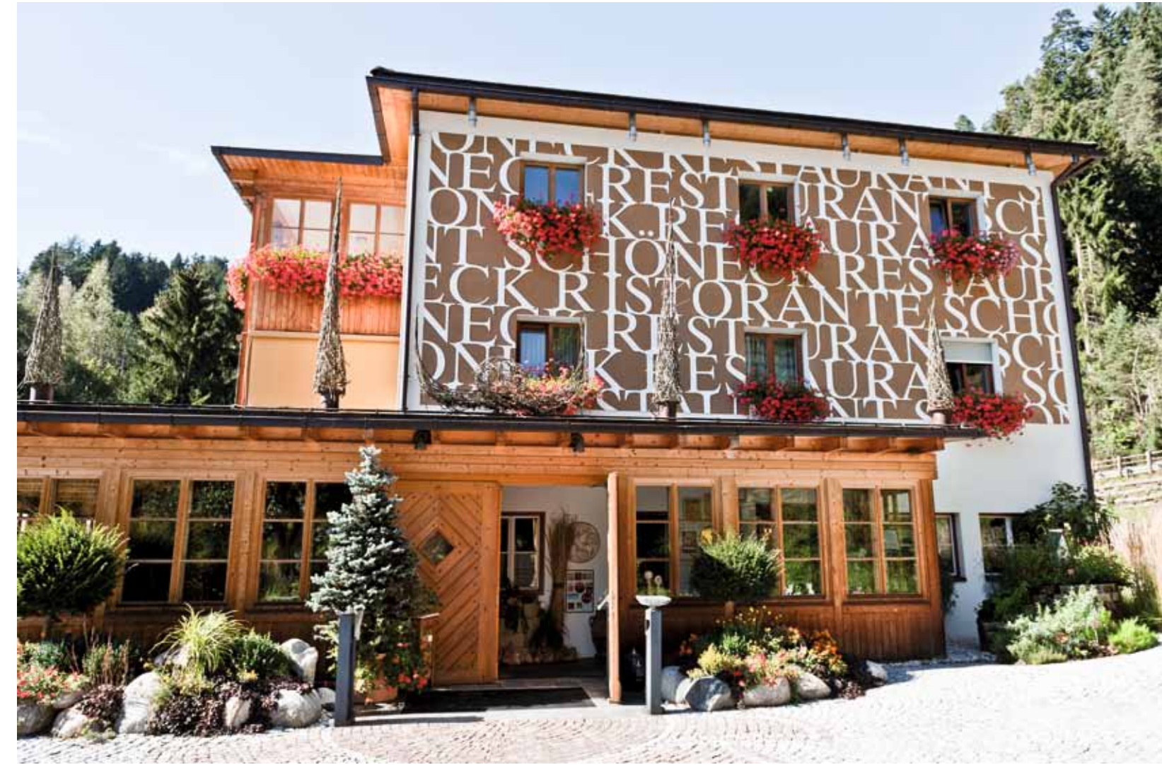
Restaurant Schöneck in Mühlen bei Pfalzen feiert gerade 25-jähriges Jubiläum. Kaum ein Gastronomieführer, in dem das Sternelokal nicht glänzend abschneidet. Die Erfolgsgeschichte beginnt wie ein Märchen. Drei junge Brüder aus bescheidenen Verhältnissen beschließen, ein eigenes Restaurant zu eröffnen: ohne Ausbildung, ohne Erfahrung.

Dass er zeitgleich Küchenchef im 4-Sterne Hotel bleibt, ist dem Kurhotel zu wünschen, denn seine Küche steht auch für „medical wellness“. Genuss und Gesundheit sollen harmo-